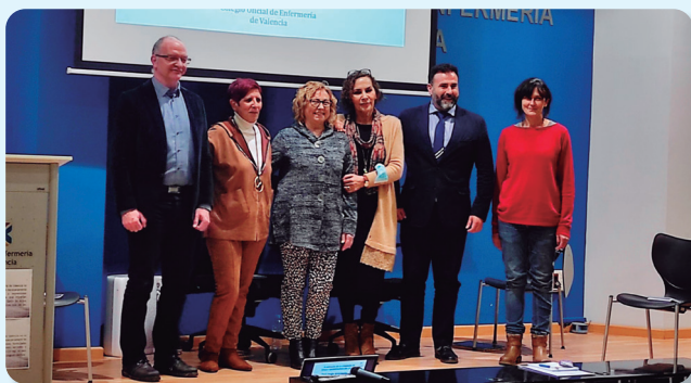
Los expertos que han intervenido en la mesa ‘Las voluntades anticipadas, de la teoría a la práctica’ de la X Jornada de Ética y Deontología del CECOVA.

La X Jornada de Ética y Deontología del Consejo de Enfermería de la Comunidad Valenciana (CECOVA) ha evidenciado la importancia del ‘testamento vital’ o ‘voluntades anticipadas’ pero, especialmente, al constituir una decisión muy trascendente en la vida, “debe tomarse en momentos de serenidad emocional y cuando todavía no existe amenaza de enfermedades”.